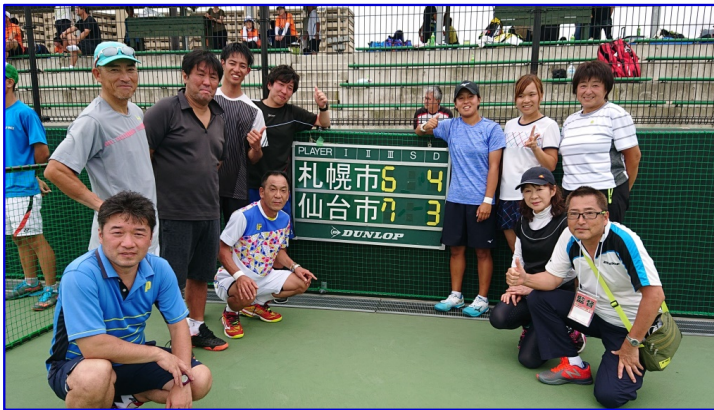
7/19日(金) 本戦1回戦 vs札幌市