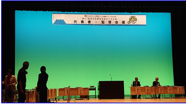
7/18日(木) 代表者・監督会議 (会場:市民文化ホール)