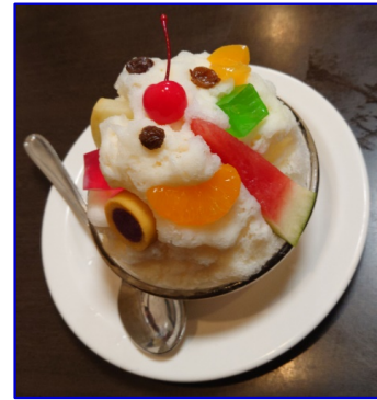
鹿児島名物しろくま