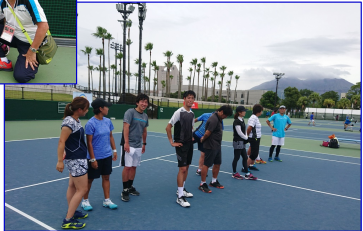
7/19日(金) コンソレ戦1回戦 vs金沢市 右上は桜島