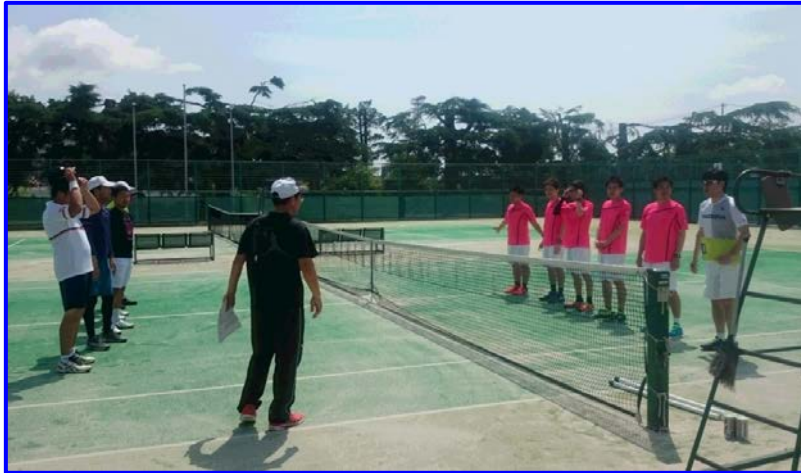
試合前のオーバー交換 ソニーTC vs ルネサンス