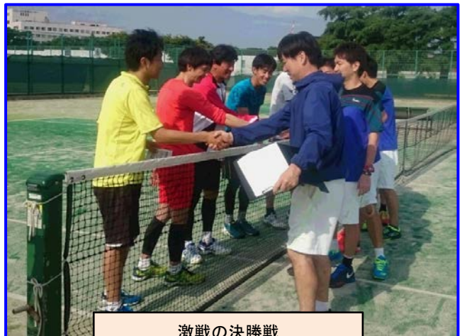
激戦の決勝戦 東北電力 ① vs ②ルネサンス