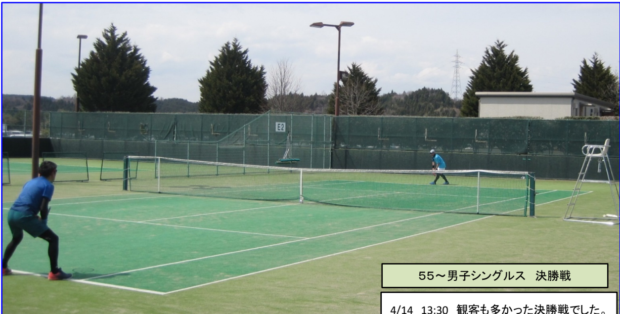
55~男子シングルス 決勝戦